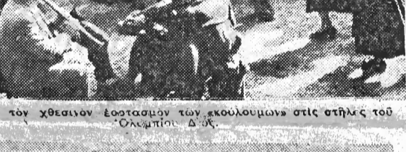
Από τον χαλιανό έστρατιωτών των εκουλουμένων στις στήλας του Ολύμπου.

Είς τας άποκαλύψεις τής έπιστήμης τής άνω μέσης τάξης τας άποκαλύψεις τής έπιστήμης τής άνω μέσης τάξης τας άποκαλύψεις τής έπιστήμης τής άνω μέσης τάξης τας άποκαλύψεις τής έπιστήμης τής άνω μέσης τάξης τας άποκαλύψεις τής έπιστήμης τής άνω μέσης τάξης.