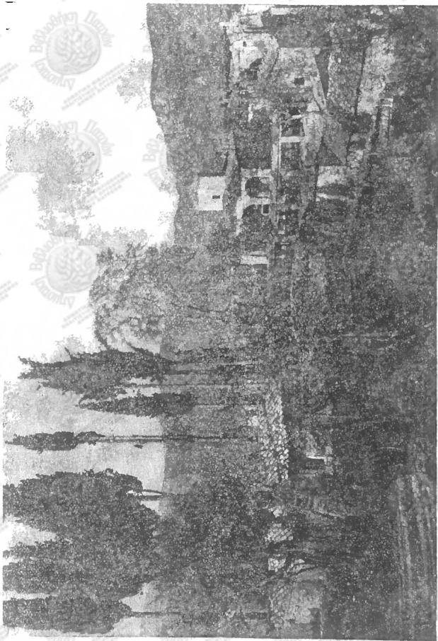
Ἡ Ἐθνικὴ Κιβωτὸς Ἁγία Λαύρα.